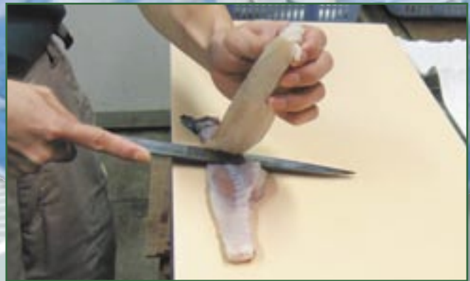
② 3枚に下ろします。(この時、中骨に少し身を付けた位の方がちり鍋や唐揚げにした時に美味です。)