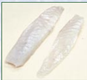
⑤ 刺身の形を整え、引き易くする為、身の3分の1位の所で柵取りをして、大きい身の高い方を向こう側にして尾の方を手前にし、尾の方から包丁を引く様にして薄く切ります。包丁を身に当て、まな板に押し付ける様にゆっくりと引き、同じ大きさになる様に引くのがコツです。小さい方の身は皿の内側を引く時使用すると良いでしょう。