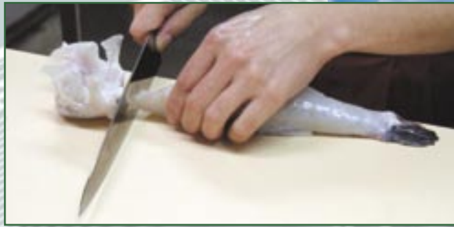
① 身欠きふぐの頭を切り落とします。