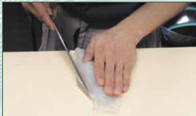
③ 身に付いている赤い部分を切り落とします。この部分はポイルして身皮としてポン酢で食べます。