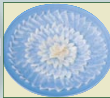
⑥ 1枚ずつ皿の外側から盛り付けます。右から左へ身の端が少し重なる様に盛り付けると綺麗に見えます。ポイルした身皮、切り皮を盛り付け、刻みねぎ・もみじおろしを添えポン酢でお召上がり下さい。